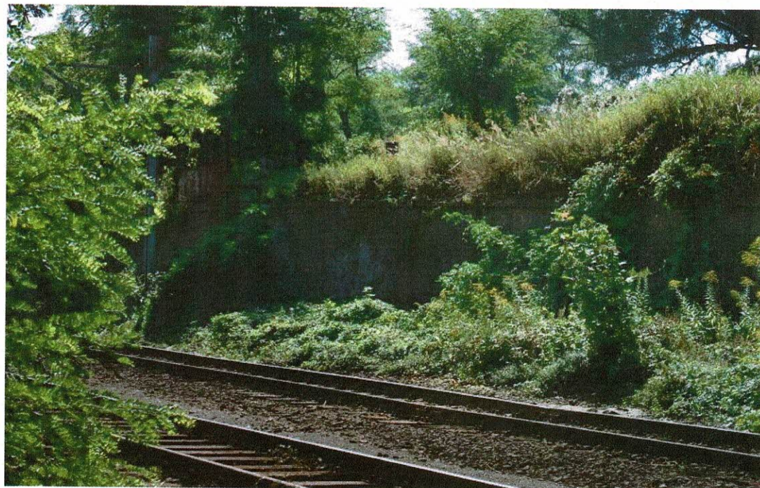
Rys. 4 Ściana oporowa przy torowisku kolejowym.