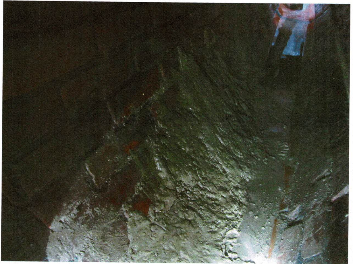
Rys. 10-11 Stan rozpatrywanego odcinka kanału S4-S5.