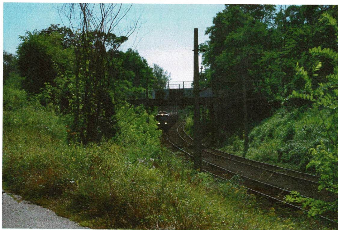
Rys. 5 Wiadukt drogowy nad torowiskiem kolejowym przy rozpatrywanym odcinku kanału.