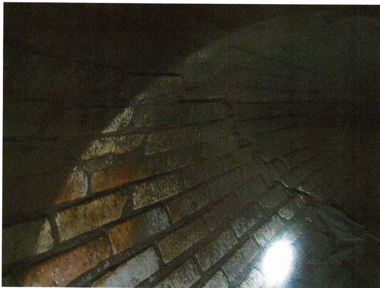
Rys. 8-9 Stan rozpatrywanego odcinka kanału S4-S5.