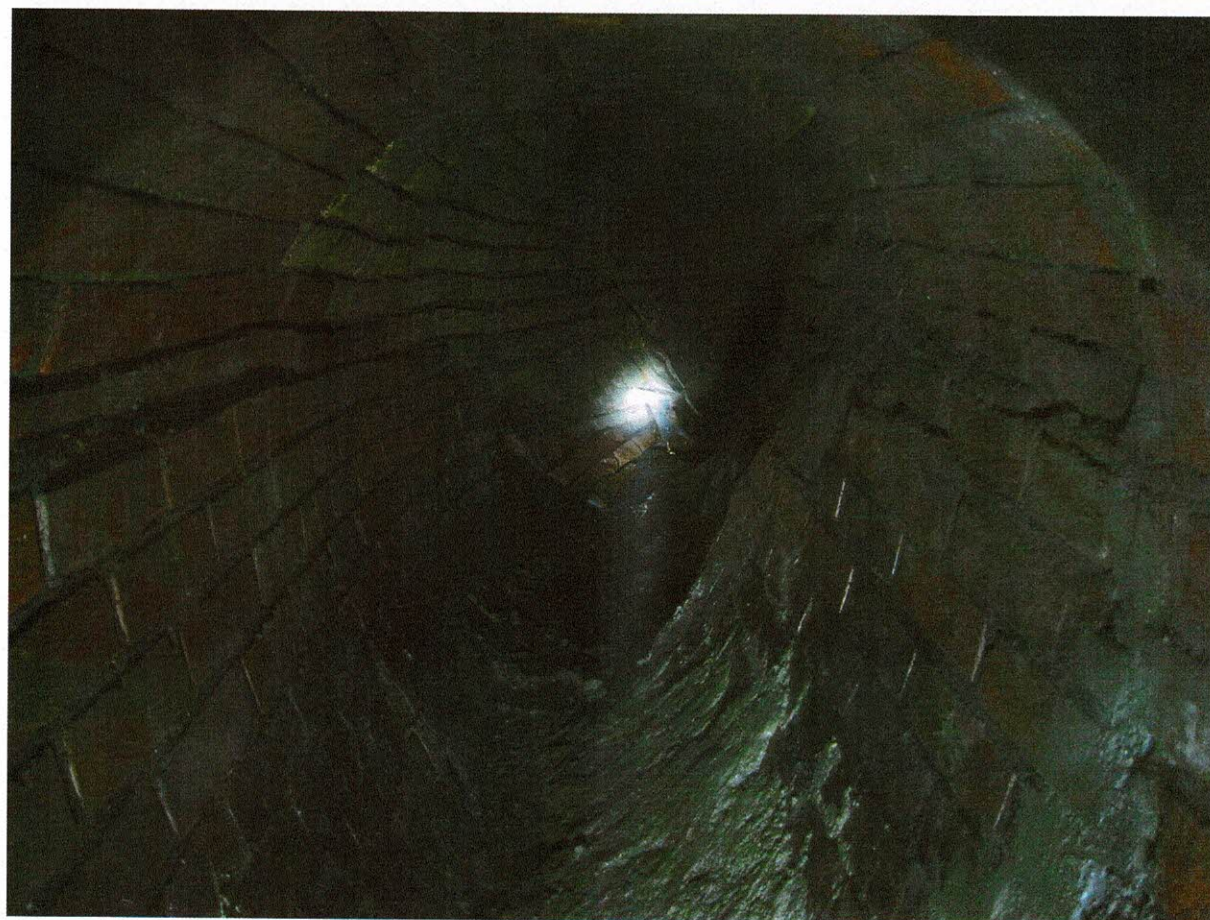
Rys. 6-7 Stan rozpatrywanego odcinka kanału S4-S5.